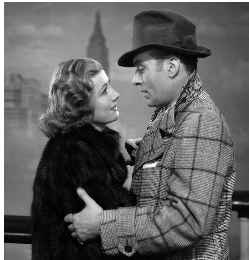
Irene Dunne e Charles Boyer in Love Affair di Leo McCarey