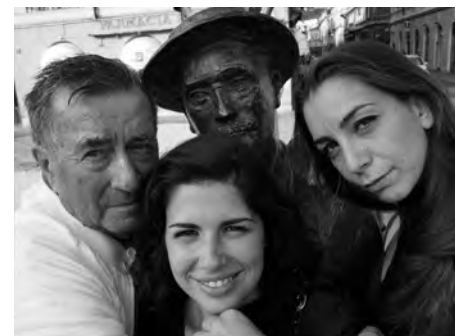
dal set di Solitudine donna

Marc Eliot, Walt Disney. Il principe nero di Hollywood , Bompiani, Milano, 1994