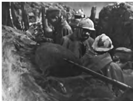
da La trincea

Regia: Vittorio Cottafavi; sceneggiatura: Giuseppe Dessì; fotografia: Giorgio Ojetti; musica: a cura di Vittorio Con-