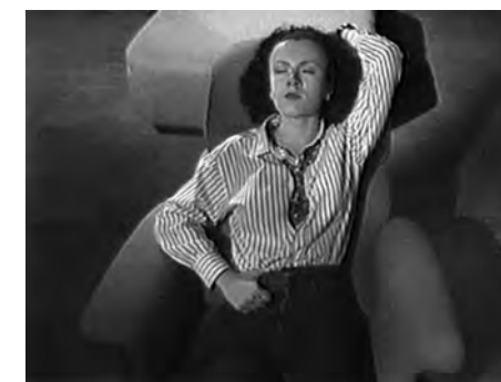
dal film Altre epifanie