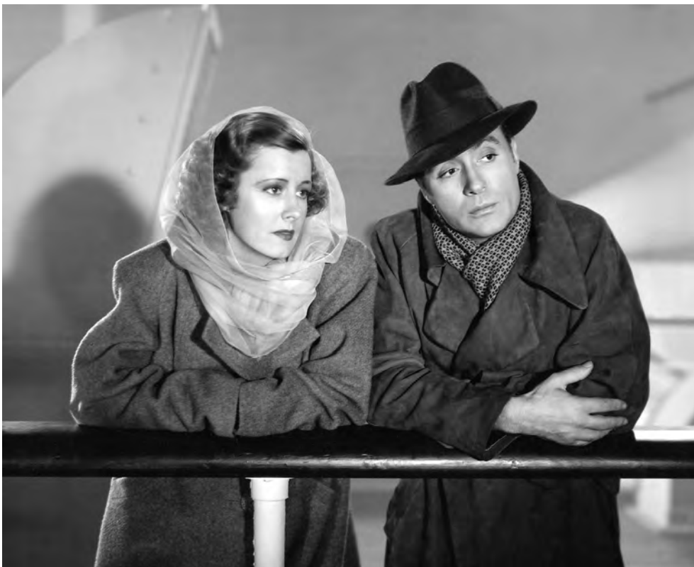
dal film Love Affair