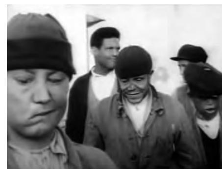
dal film Khaneh siab ast

ghese ci risuona nel cinema con la massima bellezza. E accostando il titolo originale di questo breve capolavoro della grande poetessa iraniana Forugh Farrokhzad a quello del lungometraggio che due anni dopo interpreta per il suo compagno Ebrahim Golestan ( Khesht va Ayeneh ovvero Mattone e specchio ), altro capolavoro sublime, cogliamo oltre il senso un universo di richiami. In questo corto le voci fuori campo sono di Forugh e Ebrahim appunto, e lei dice con voce stupenda i suoi meravigliosi testi poetici, mentre gli "attori" sono i lebbrosi della "casa nera" (compagni di quelli dell'isola greca in L'ordre di Pollet), che nel finale escono verso di noi come gli operai di Lumière e di Comerio dalla fabbrica. Le poche cose che qui possiamo dirne bastano a evidenziare che ci troviamo di fronte alla massima bellezza del cinema. Infatti chi scrive ha incluso questo titolo nella top ten dei migliori film di tutti i tempi per il sondaggio 2012 di "Sight & Sound" (insieme a un altro film di cineasta femminile, Larisa Šepit'ko, e non certo per rispettare quote o correttezze). L'opera di Farrokhzad e Golestan, insieme a quella del di poco posteriore Sohrab Shahid Saless (morto esule in America dopo un periodo tedesco, mentre Golestan vive in Gran Bretagna, e Forugh muore in un incidente automobilistico nel 1967) segnala che il cinema iraniano esule in patria dell'era Pahlavi raggiunge vertici superiori ai pur grandi apolidi dell'Iran islamista (Naderi, Kiarostami, Makhmalbaf).