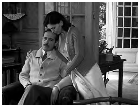
da Triple agent

«Personalmente ogni volta che vedo un film di Lumière resto attonito. Che cosa appare démodé nei film di Lumière? La borghesia. Che cosa appare moderno nei film di Lumière? Il popolo. Perché? Rispondere a questa domanda richiede analisi approfondite. Dai primi del Novecento l'evoluzione sociale è stata tale