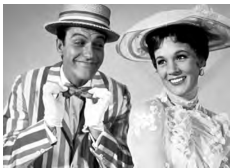
da Mary Poppins