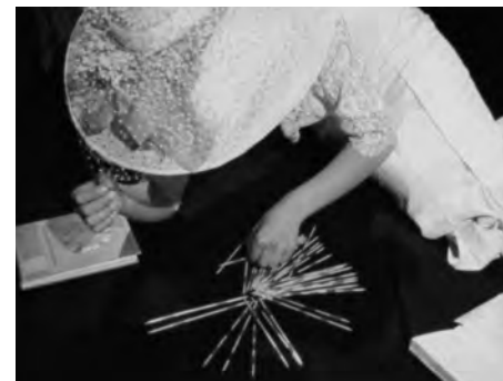
da Engel und Puppe

politico omogeneo uscito dalle battaglie interne al CSC) è stato presentato alla Biennale di Venezia 1974, dove trovandosi in "concorrenza" con proiezione e conferenza-stampa di Antonioni, non ha trovato molta eco. È stato inoltre presentato al Kurzfilmtage 1975 di Oberhausen, nella sezione Studentenfilme, riscuotendo buone valutazioni da parte della critica (è stato scelto per il Festival di Tolone e invitato a Locarno).