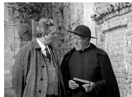
da Incontro con il padre

viaggio verso l'Argentina, i protagonisti affronteranno le insidie e insieme le responsabilità della vita in comune, alla riscoperta di un sentimento di identità collettiva. Un film che ci restituisce il faticoso risveglio della democrazia italiana, alla ricerca di nuovi modelli cinematografici che interpretino lo spirito dei tempi».